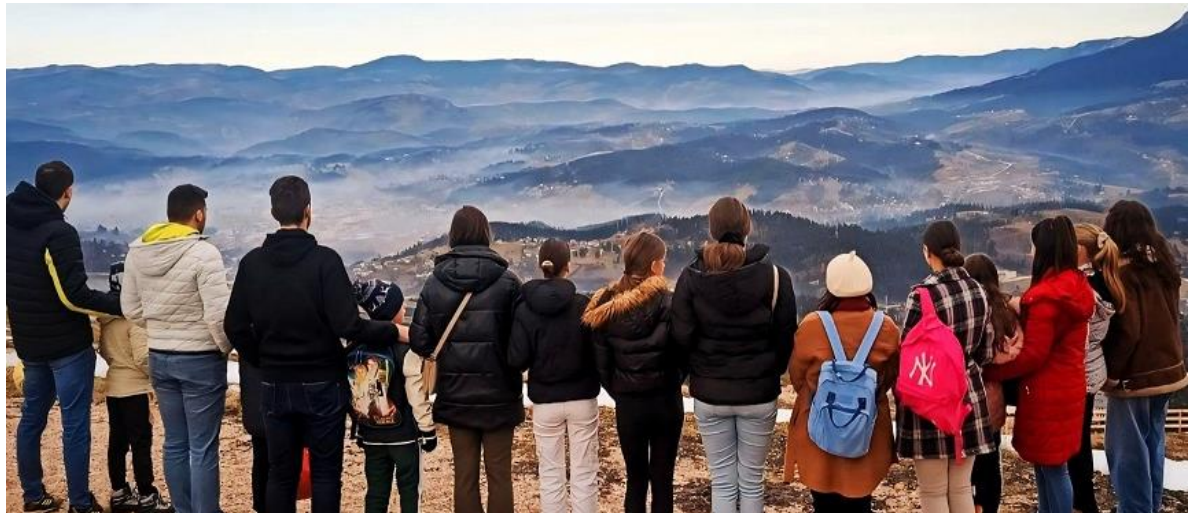
Erste informelle Gruppe von Studierenden und Kindern auf dem gemeinsamen Ausflug. Sie haben sich für das Ältere Schwester, älterer Bruder Programm in Pale (Republika Srpska) stark gemacht.

Werden sie eine gemeinsame Zukunft haben – zusammen mit jungen und älteren Menschen in Bosnien und Herzegowina?