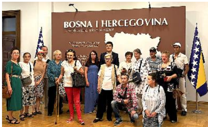
Auf dieses Bild mit dem Bürgermeister der Stadt Sarajevo sind die Teilnehmer*innen besonders stolz