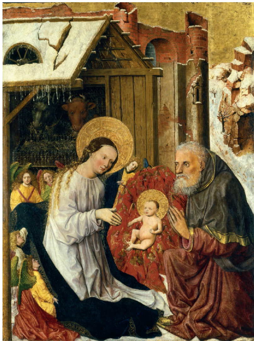
Meister der Münchner Marien Tafeln (tätig um 1450): Geburt Christi, um 1445/1450, Tempera auf Nadelholz, 107 x 80,5 cm, Kunsthaus Zürich, 1936; Bild zur Verfügung gestellt.

Wie die Hirten machen sich auch die Weisen aus dem Morgenland auf und kommen zur Krippe. Sie sind fremd und fern und kommen nah, zu Gott, der in Jesus endgültig nahbar wird. Sie suchen, fragen, schreiten voran und finden. Ihre Reise steht für den Glau-